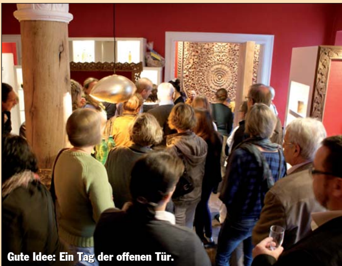
Gute Idee: Ein Tag der offenen Tür.

Der Leitfaden für Existenzgründer in der Thai Massage ist in deutscher und thailändischer Sprache kostenlos als pdf-Datei erhältlich. Bestellung an Info@wanyo.de