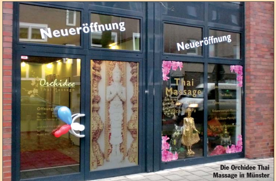
Die Orchidee Thai Massage in Münster

trieb eines Kleinunternehmens nützlich wären, haben sie nicht. Viele sind aber "bauernschlau", was mit Blick auf den häufigen familiären Hintergrund in der thailändischen Landwirtschaft nahe liegt. Wenn sich diese Bauernschläue mit ausreichenden deutschen Sprachkenntnissen, etwas betriebswirtschaftlichem Grundwissen und etwas Einsicht in das deutsche Rechts- und Steuersystem verbindet, dann entstehen, wie viele Beispiele beweisen, erfolgreiche und zufriedene (Klein-)unternehmerinnen. Die Partner oder Ehemänner sind gefordert (und manchmal leider überfordert), diesen Weg zu unterstützen. Manche können das nicht, weil sie selber über keinerlei